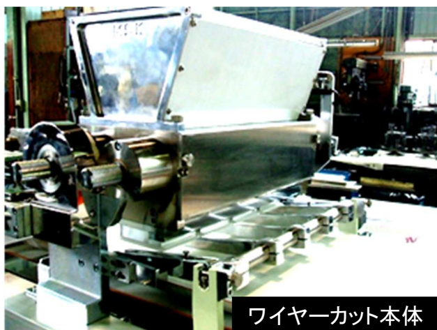
ワイヤーカット本体